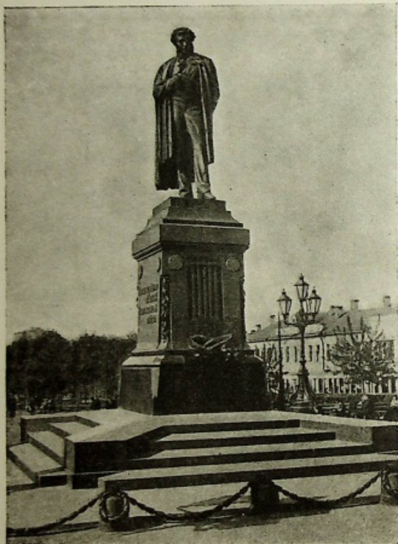
Памятник А. С. Пушкину в Москве